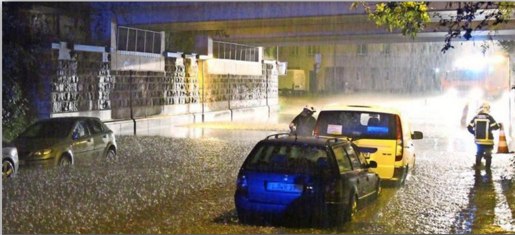
Überschwemmung Leipzig-Sellerhausen, Juni 2019