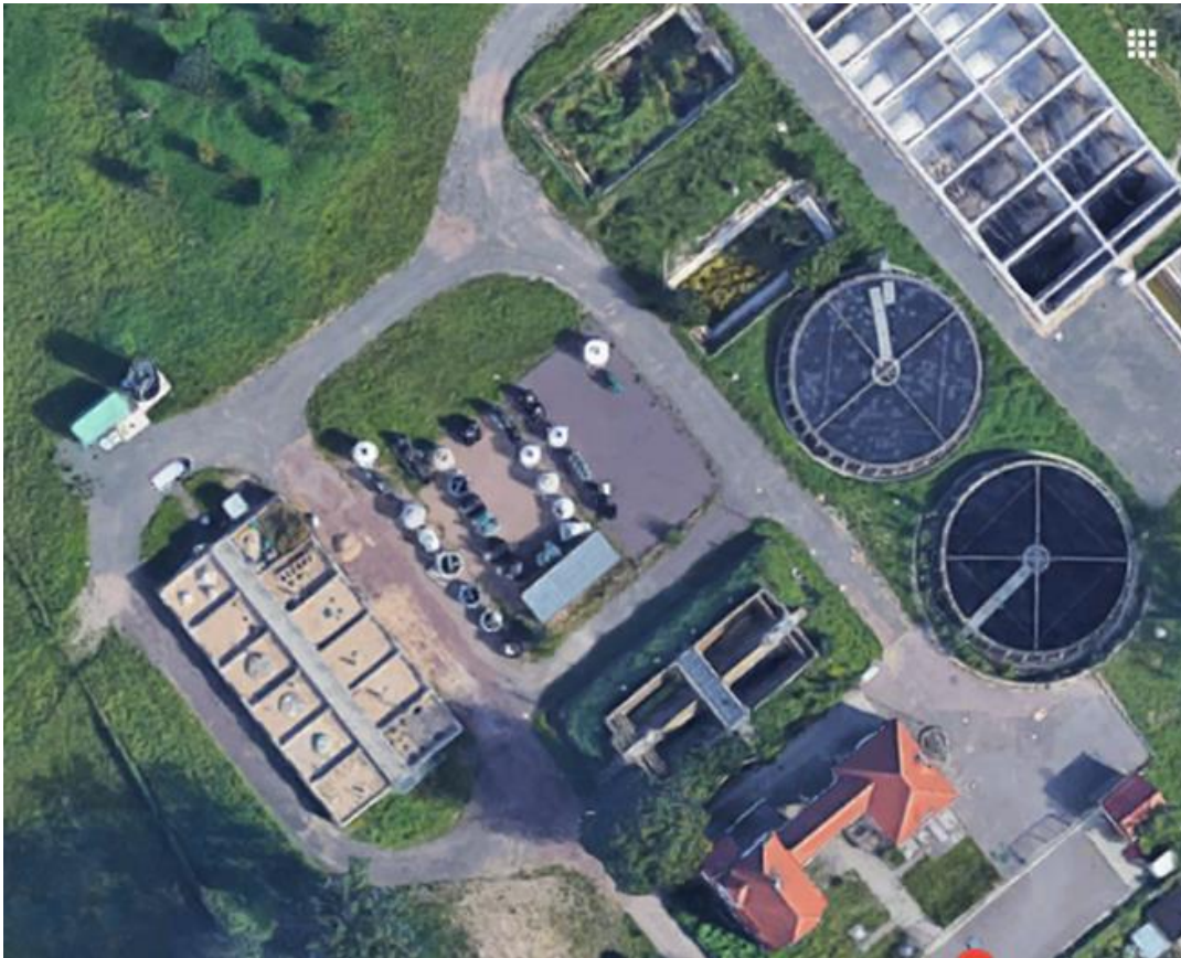
Standort: Kompetenzzentrum in Leipzig/Leutzsch