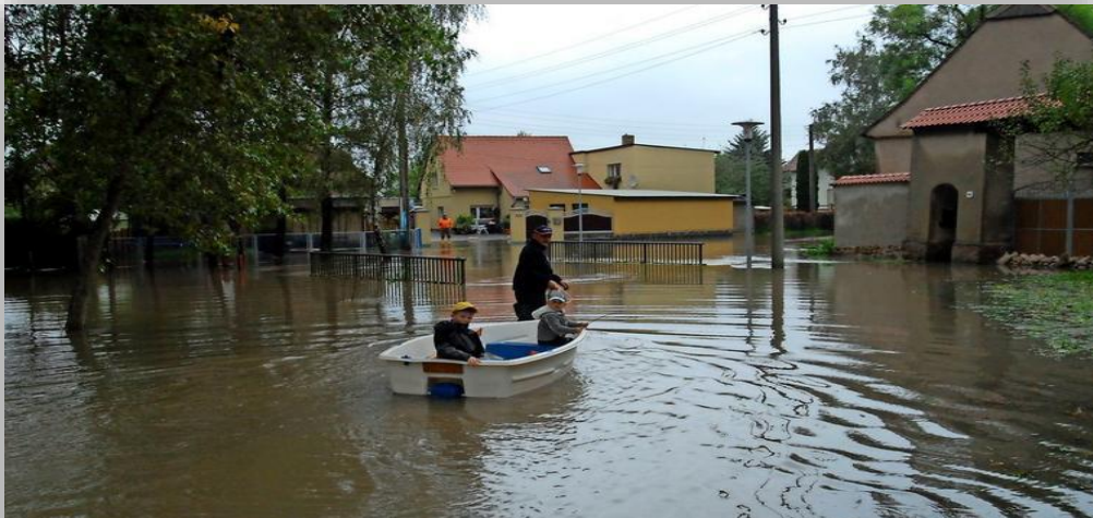
Strengbach-Brücke am Kleinen Dorf in Wiedemar, Foto: Privat, 2009